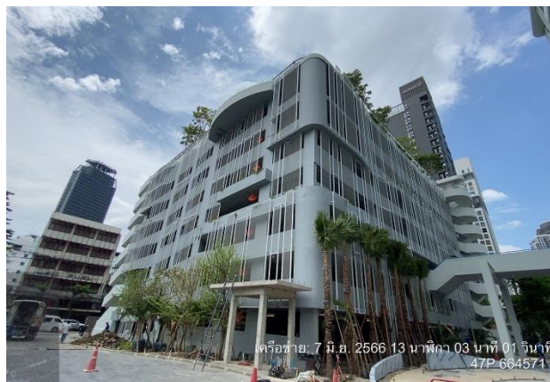
รูปที่ 1-1 สภาพภายในพื้นที่โครงการ ระหว่างเดือนมกราคม ถึงเดือนมิถุนายน พ.ศ.2566